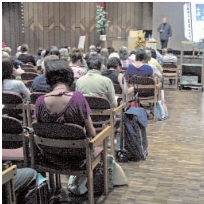
50 parallel laufende Vorträge und praxisorientierte Seminare zu neuen und traditionellen Diagnose- und Therapiemethoden boten den Teilnehmerinnen und Teilnehmern vielfältige Möglichkeiten zur Weiterbildung.

sich tiefer in die Möglichkeiten unserer Disziplinen einzuarbeiten. Wenn das so ist, hat sich alleine schon deshalb der große Aufwand gelohnt.