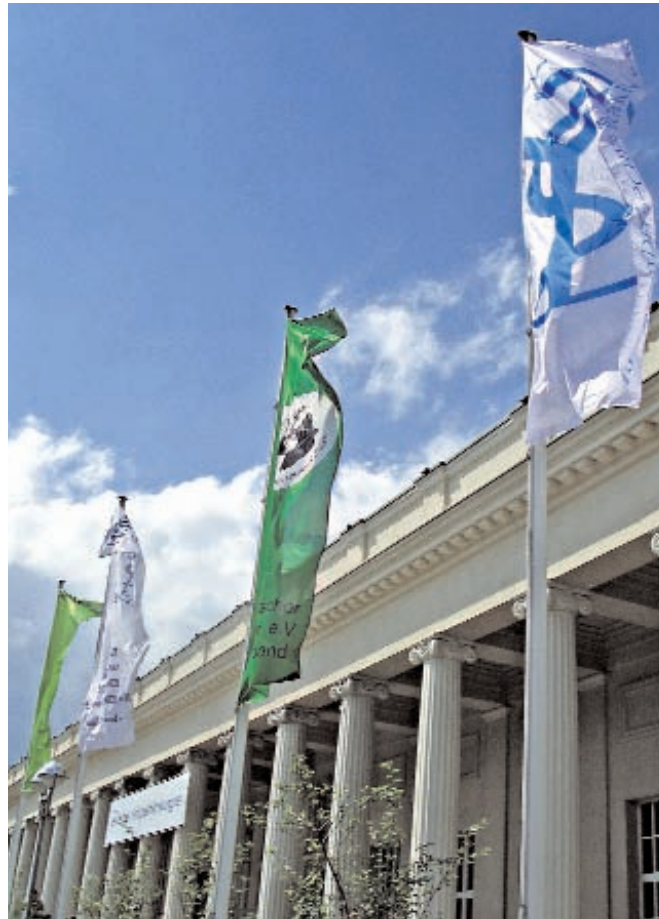
Die DDH vertreten die überwiegende Mehrheit der in Deutschland zugelassenen Heilpraktikerinnen und Heilpraktiker.