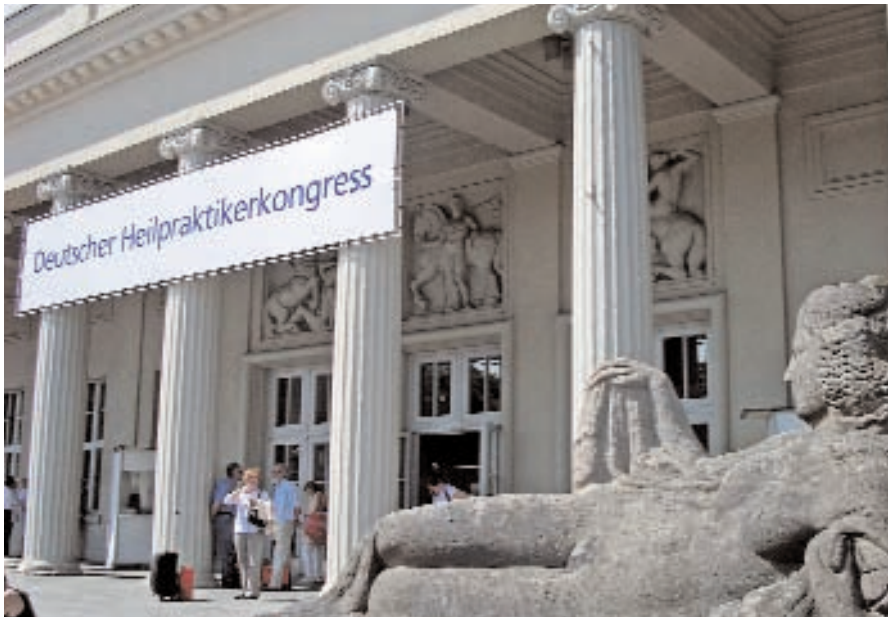
2.200 Kolleginnen und Kollegen fanden den Weg in das Messe- und Kongresszentrum.

Am 12./13.6. fand in Karlsruhe der 20. Deutsche Heilpraktikerkongress statt. Es ist der größte Heilpraktikerkongress, der von den DDH durchgeführt wird. Zwischen den 50 Fachvorträgen und Seminaren zur naturheilkundlichen Diagnostik und Therapie konnten sich die Kolleginnen und Kollegen in der Industrieausstellung über bewährte und neue Präparate und Methoden informieren.